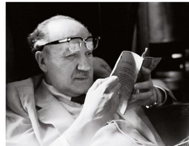
Scheiber Sándor (1913–1985)