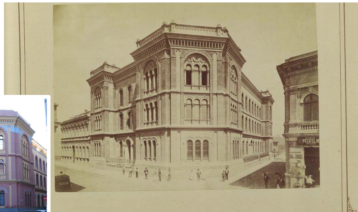
A Rabbiképző épülete, 1877 körül