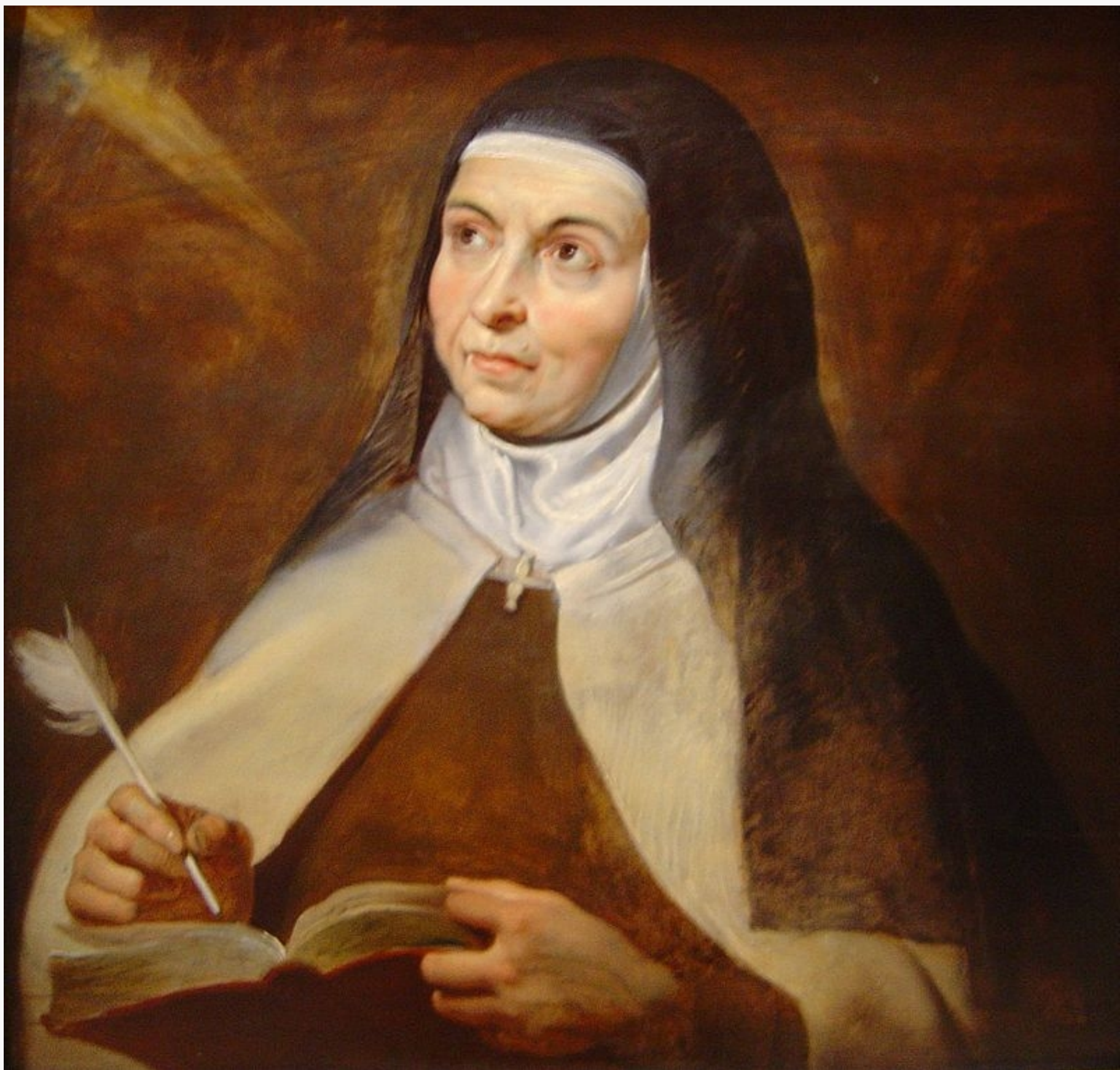
Peter Paul Rubens, Ávilai Szent Teréz, 1615