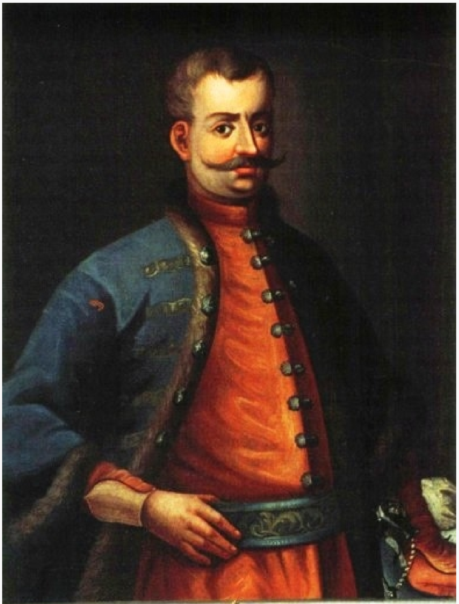
Serenif. Franciscus Transylvania Hospes cum a periculo vita liber evasisset AD 1703. Rakoczy Princeps in Collegio Podoliner Neostadio mirabiliter evasisset AD 1703.