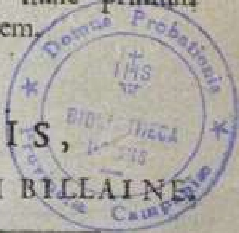
Az első kiadás címlapja