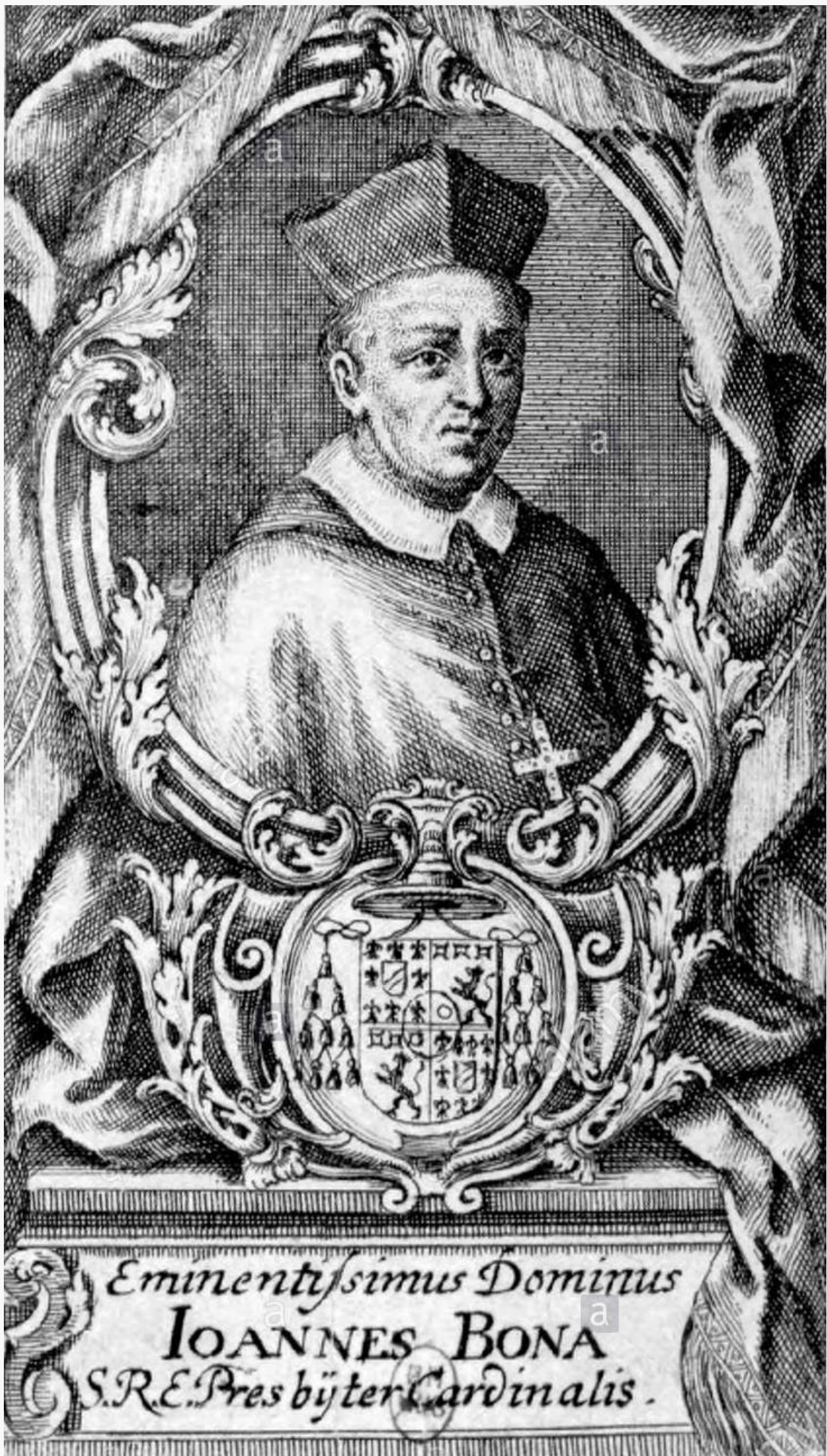
Giovanni Bona 1609–1674