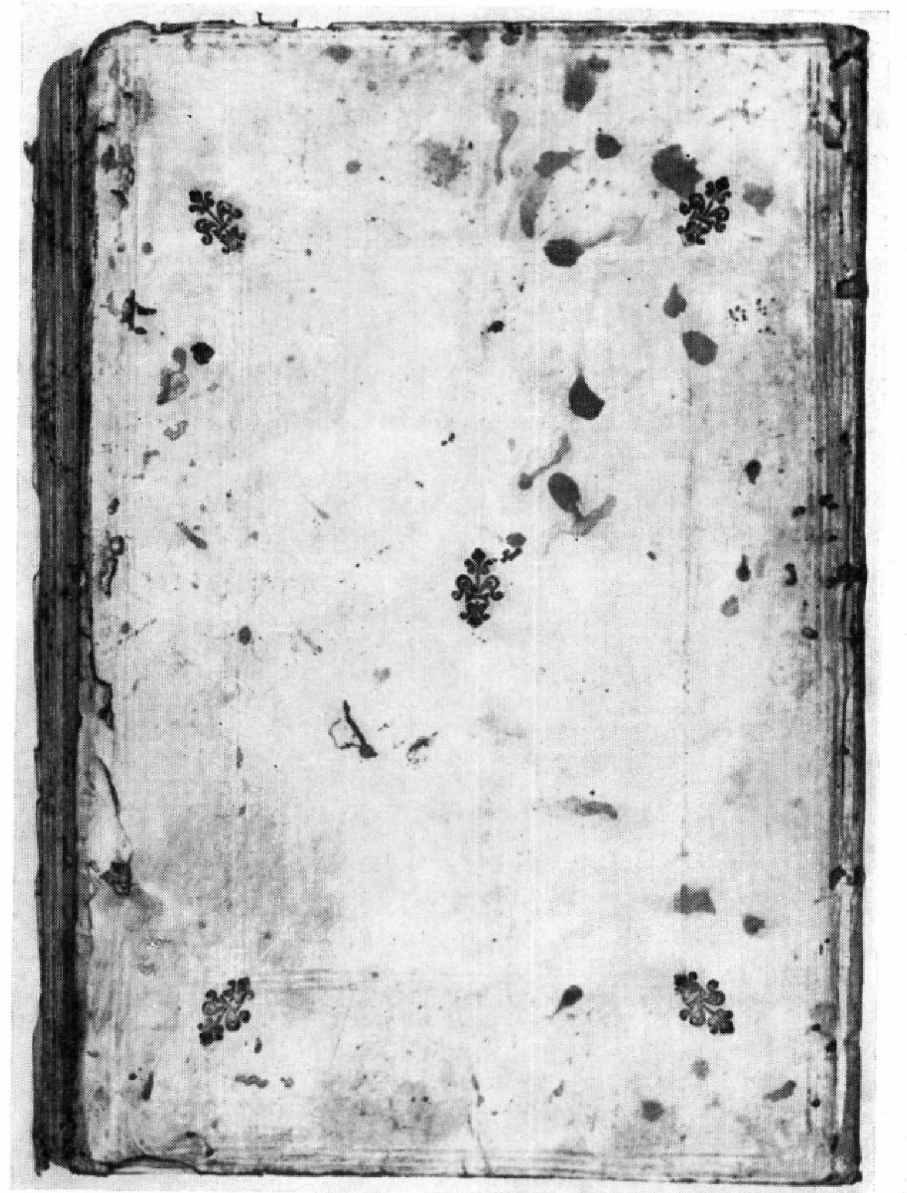
A Fol. Lat. 3606/I. jelzetű kódex hátulsó kötéstáblájának díszei